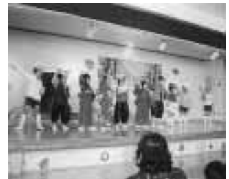
▲各保育所で保育発表会やアイサービス交流会が行われました。(左上:新地保育所、右上:福田保育所、左下:駒ヶ嶺保育所、右下:浜保育所)