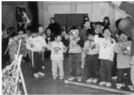
▲初めての触る楽器に大喜び

保育所では、毎年お子さんの様子を見ていただくため、保育参観や祖父母参観などを行っています。お子さんと一