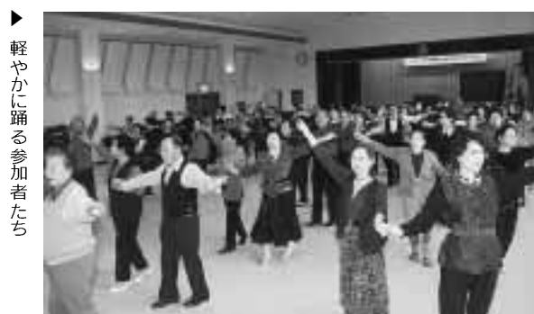
軽やかに踊る参加者たち

第9回 町民親善卓球大会 町体育協会主催の第9回町民親善卓球大会が12月23日、町総合体育館で町民ら約1000人が参加して熱戦を繰り広げました。 競技は、1ゲーム21点の3ゲームマッチで男女別に小学生、中学生、高校生一般などシングルス8部門のほか男女別のダブルスや混合ダブルスなど計12部門に分かれて行われ、上位入賞者には賞状・賞品が贈られました。