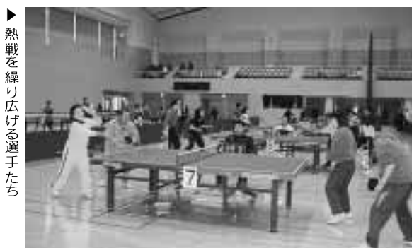
熱戦を繰り広げる選手たち

若々しいですねシルバードانسパーティー 60歳以上の男女を対象としたシルバードダンス3地区合同ダンスパーティーが12月13日、農村環境改善センターで行われ、町内の愛好者約90人が軽やかなステップを踏みながらダンスを楽しみました。 ダンスは、背筋を伸ばして踊ることにより、足腰を丈夫にし、老化を防ぐ効果や男女が互いに組んで踊ることにより精神的な若返りにもなると言われています。